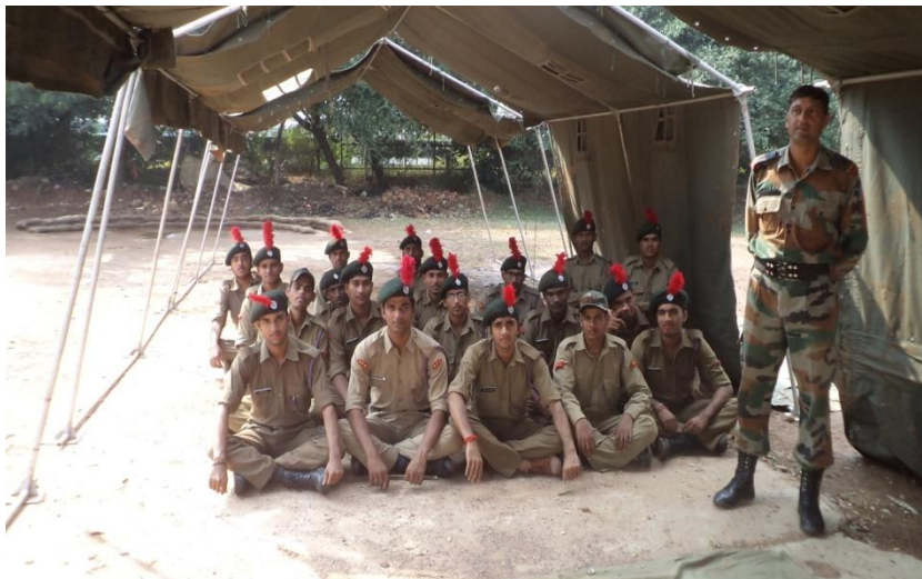
NCC Cadets in Camp