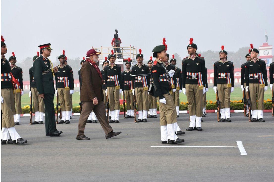
Guard of Honour to Hon'ble Prime Minister