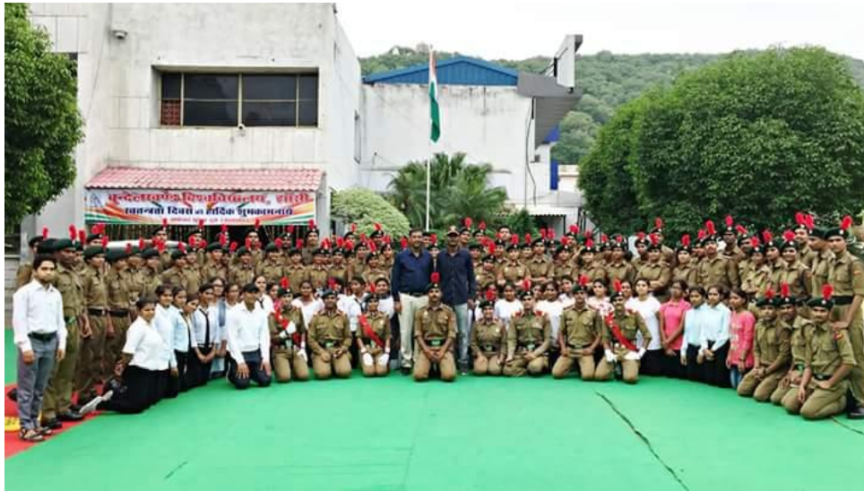
Ncc Cadets on Independence Day